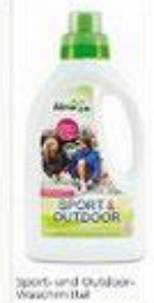
Sport- und Outdoor-Waschmittel

Bitte beachte jedoch, dass ökologisches Waschmittel Funktionskleidung für Textilien aus Wolle und Seide nicht geeignet ist.